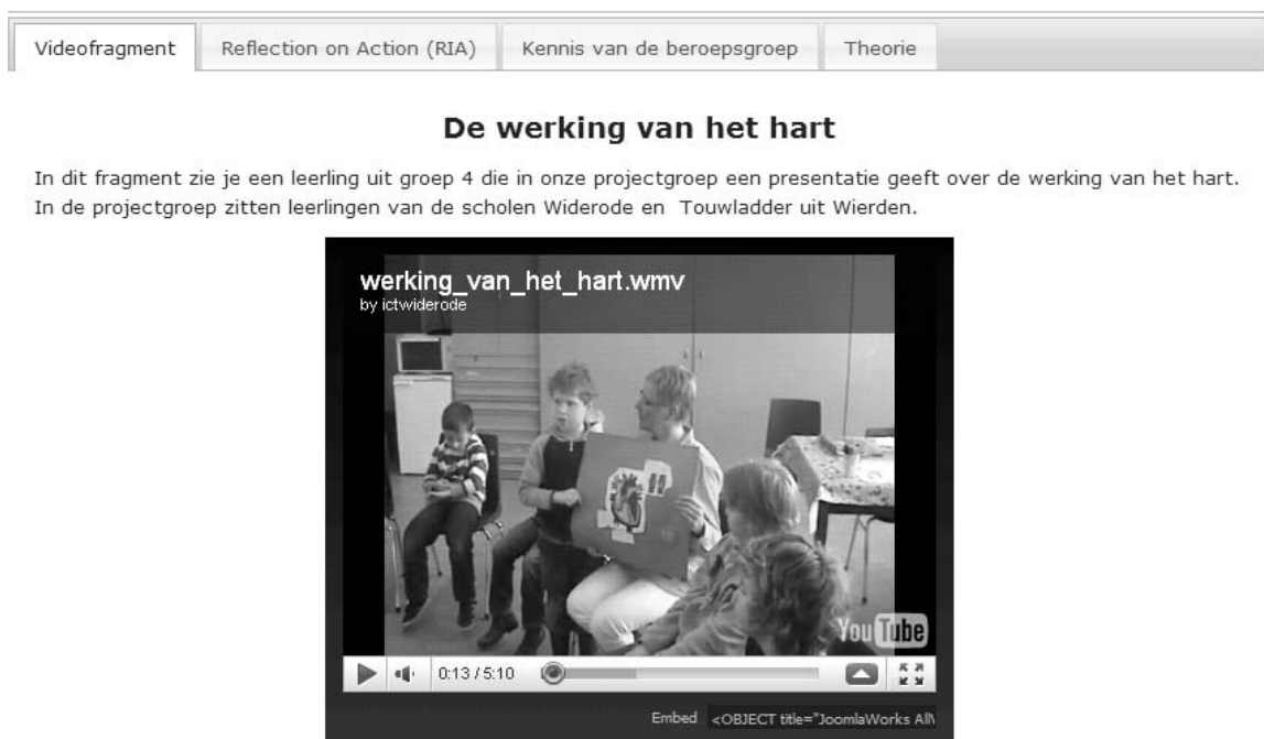
Figuur 1: Schemafbeelding van een rich media casus

De derde schil aan informatie bestaat uit wat Cochran-Smith en Lytle kennis-voor-de-praktijk noemen. Hier gaat het om formele kennis zoals algemene theorieën en onderzoeksuitkomsten uit verschillende disciplines. Dit type kennis wordt ook wel gecodificeerde kennis genoemd omdat er meestal een schriftelijke neerslag van is. Studenten van lerarenopleidingen vatten deze kennis vaak samen onder de noemer: 'de theorie'. In het project Zicht op Excellentie zorgt de verbinding tussen het excellente professionele handelen en de theoretische achtergrond voor een breder, generalistisch, perspectief. Toevoegen van drie informatieschillen helpt, zo is onze verwachting, de toeschouwers om de video-opnamen van excellent leraarsgedrag te interpreteren. Learn-to-notice en knowledge based reasoning zijn de begrippen die van Es en Sherin (2008) daaraan verbinden. De drie informatieschillen richten de aandacht van de kijker op die aspecten van de video-opname die door de ontwerpers als relevant voor excellent leraarsgedrag zijn aangemerkt. Deze gerichte aandacht draagt op haar beurt weer bij aan de ontwikkeling van kennis over excel-